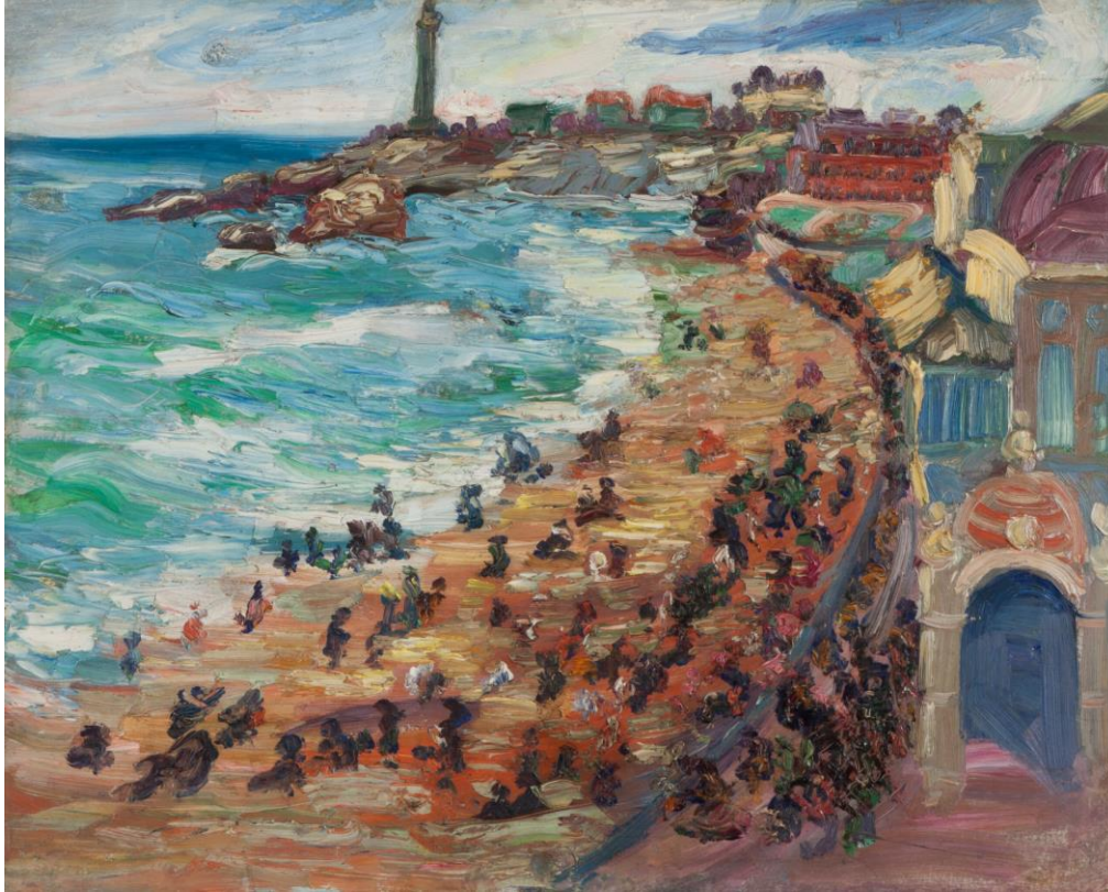
Plaża u Bretanji, 1910. Narodni muzej Srbije, Beograd

društvenom i umetničkom životu, Nadežda je snažno propagirala svoje stavove kako umetnik treba biti deo internacionalnog okruženja, ali bez potiskivanja svog nacionalnog identiteta, kao i da se zajedničkim radom i povezivanjem južnoslovenskih naroda mogu najbolje prikazati karakteristike našeg jugoslovenskog i srpskog podneblja.